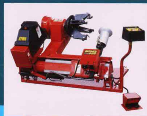
WING ニューバージョンシステム