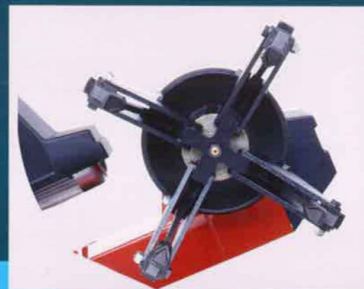
ワイドで正確なチャッキングシステム