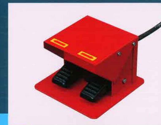
コントロールしやすいフットペダルユニット