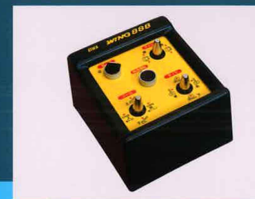
イラスト付の見やすいコントロールユニット