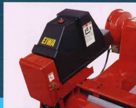
カバーで保護されたコンパクトな油圧ユニット